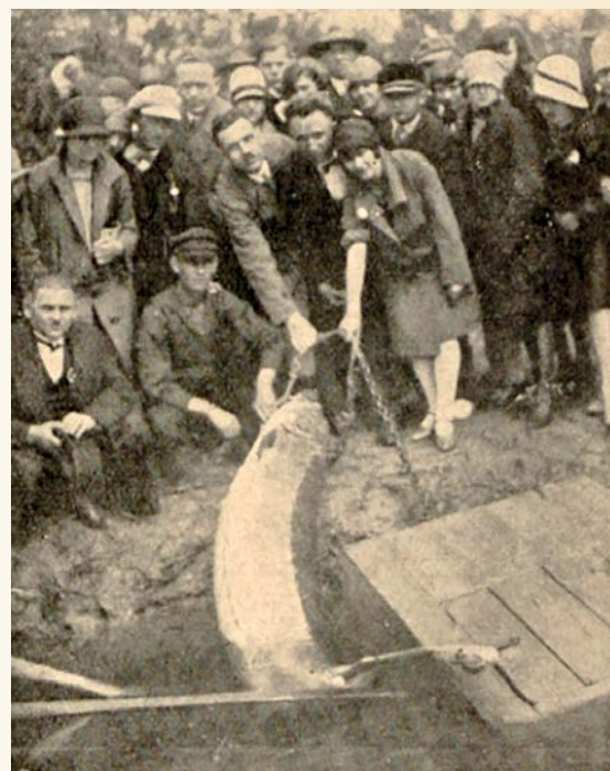
Fot. 2. Członkowie Chóru Kolejowego z jesiotrem (Anonim 1928b).

W 1518 r. orszak włoskich dostojników zatrzymał się w Warce, gdzie podano im „niezmiernej wielkości jesiotra”, złowionego w Pilicy. Mam fragment skanu strony z tą informacją, ale nie mogę odszukać nazwy publikacji, z której pochodzi. Inne źródła potwierdza-