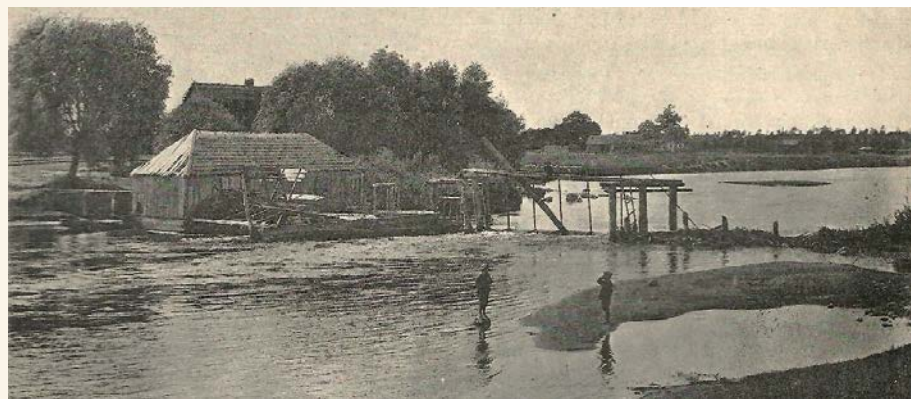
Fot. 4. Młyn pływający na Pisie w Morgownikach.

W kontekście zmniejszającej się populacji jesiotra w Polsce na przełomie XIX i XX w., już wcześniej pojawiła się próba ustalenia – czy i do których dopływów Wisły, zwłaszcza Bugu, Narwi, Wieprza i Pilicy, wpływały jesiotry. Dwukrotne apele H.W. (1902,