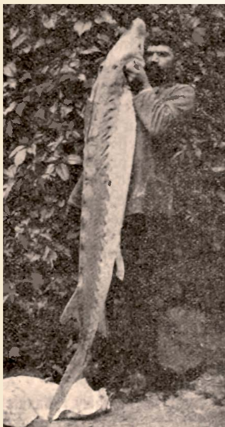
Fot. 3. Jesiotr z Wisłoki (Rozwadowski 1906).

Benecke (1882) wspominał, że miał doniesienia o dawnych, sporadycznych połowach jesiotra w jeziorze Śniardwy. Seligo (1906) stwierdził, że jesiotr dochodził do górnych odcinków Bugu, ale nie podał źródła swoich informacji. Ślaski (1917) natomiast podał, że „do niedawna” jesiotry nie były rzadkością w Narwi. Może chodziło mu o dolny odcinek rzeki? Jesiotry łowione